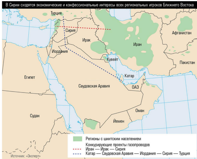
В Сирии сходятся экономические и конфессиональные интересы всех региональных игроков Ближнего Востока

Правительство объявило о предстоящем банкротстве крупнейшего авиаперевозчика страны — компании «Трансаэро», что обернется неизбежными потерями как для отрасли авиаперевозок, так и для потребителей. Однако катастрофы могло и не быть, если бы ранее правительство не самоустранилось от решения системных проблем отрасли гражданских авиаперевозок