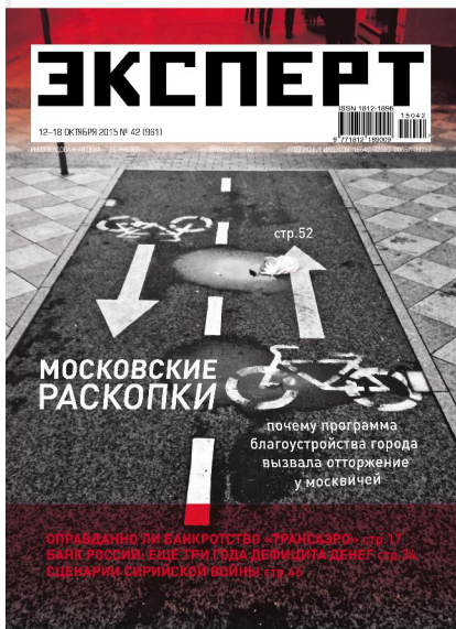
Эксперт №42 (961)