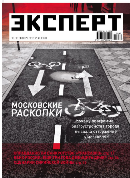
Эксперт №42 (961)