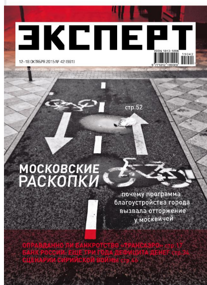
Эксперт №42 (961)